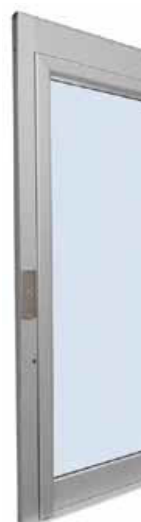
PANORAMICA IN ALLUMINIO ANODIZZATO NATURALE