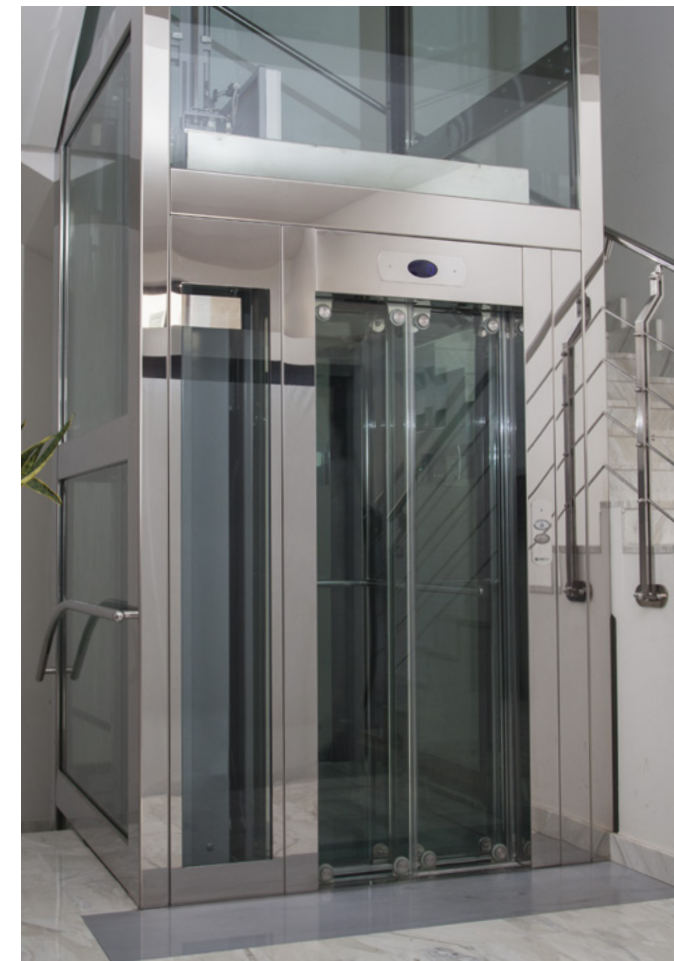
FULL GLASS CON BORCHIE IN ACCIAIO