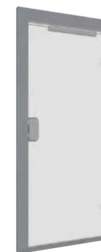
PANORAMICA FULL GLASS CON TELAIO RIVESTITO IN ACCIAIO A SCELTA DEL CLIENTE