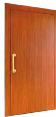
ALLUMINIO EFFETTO LEGNO

*In lamiera verniciata a polvere in tinta RAL a scelta del cliente.