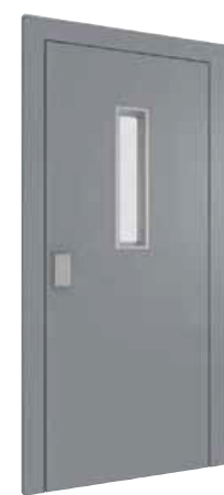
PORTA CON FINESTRATURA*