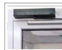
Apriporta automatico per porte a battente