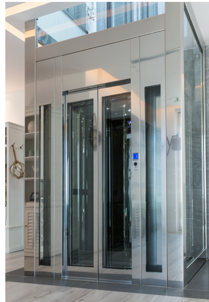
TELAIO CON AFFIANCO PANORAMICO