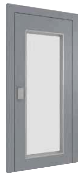
PORTE PANORAMIQUE *

* En tôle thermolaquée de couleur RAL au choix du client.