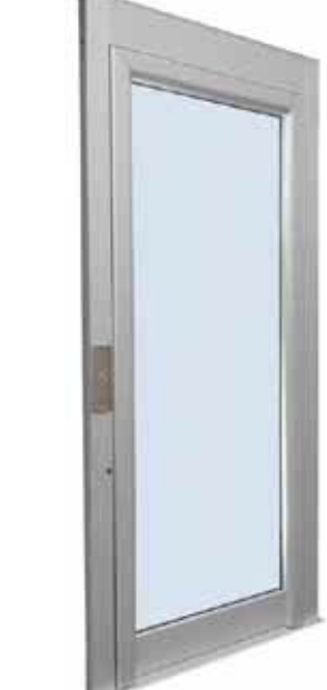
PANORAMIQUE EN ALUMINIUM ANODISÉ NATUREL