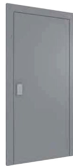
PORTE PLEINE *