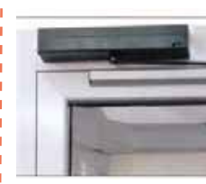
Ouvre-porte automatique pour portes battantes