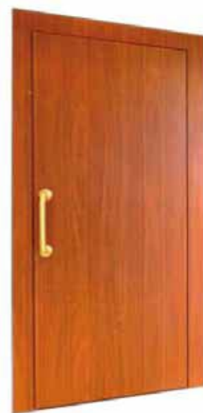
REVÊTUE EN BOIS /BOISERIE