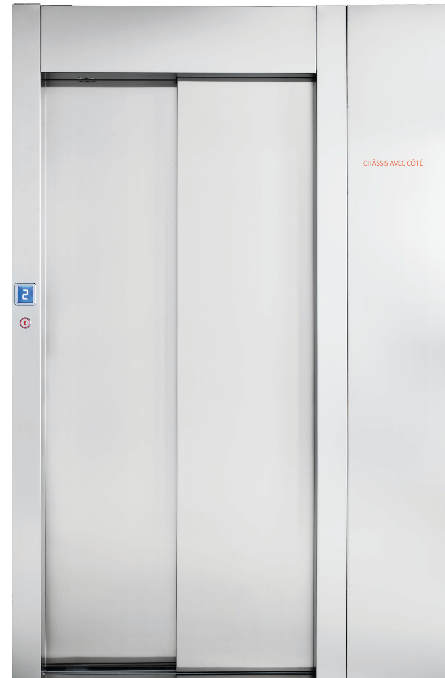
CHÂSSIS AVEC CÔTÉ