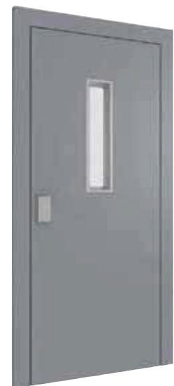
PORTE AVEC OCULUS*

* En tôle thermolaquée de couleur RAL au choix du client.