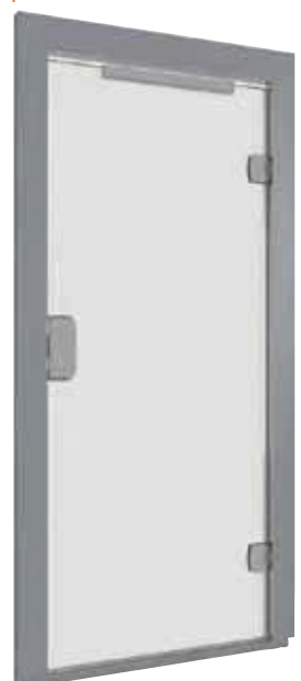
PANORAMIQUE ENTièrement VITRÉE AVEC CHÂSSIS EN ACIER AU CHOIX DU CLIENT