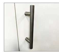
Poignée acier inoxydable