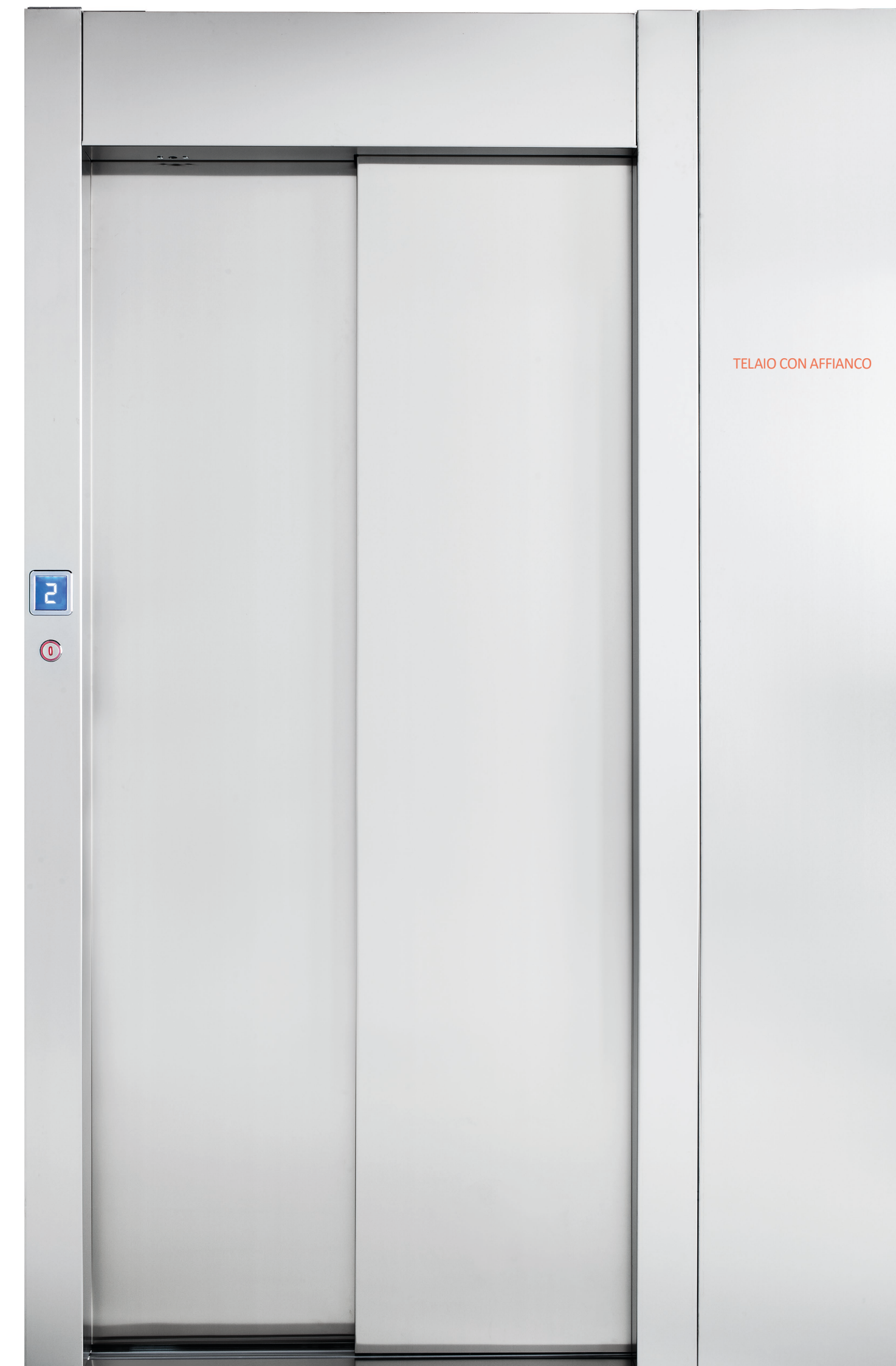
TELAIO CON AFFIANCO