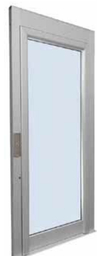
PANORAMICA IN ALLUMINIO ANODIZZATO NATURALE