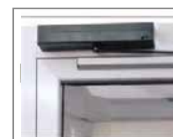
Apriporta automatico per porte a battente