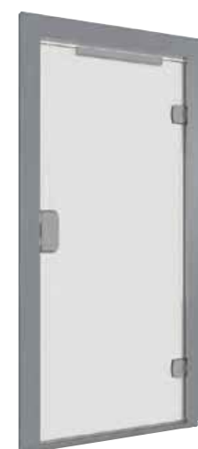
PANORAMICA FULL GLASS CON TELAIO RIVESTITO IN ACCIAIO A SCELTA DEL CLIENTE