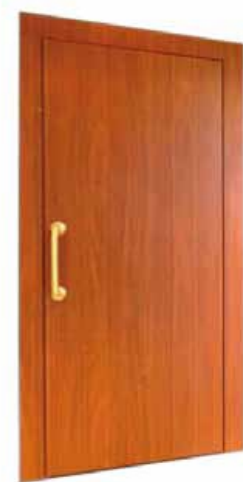
RIVESTITA IN LEGNO

*In lamiera verniciata a polvere in tinta RAL a scelta del cliente.