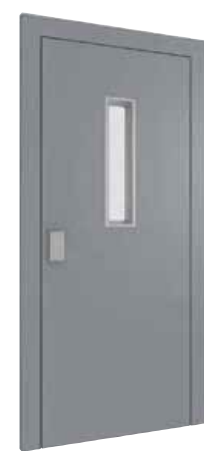
PORTA CON FINESTRATURA*